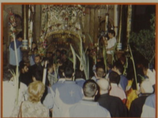
Կիր. 20 Ապրիլ 08. - Ծաղկազարդի Թափօր Ս. Յարութեան Տաճարին մէջ: