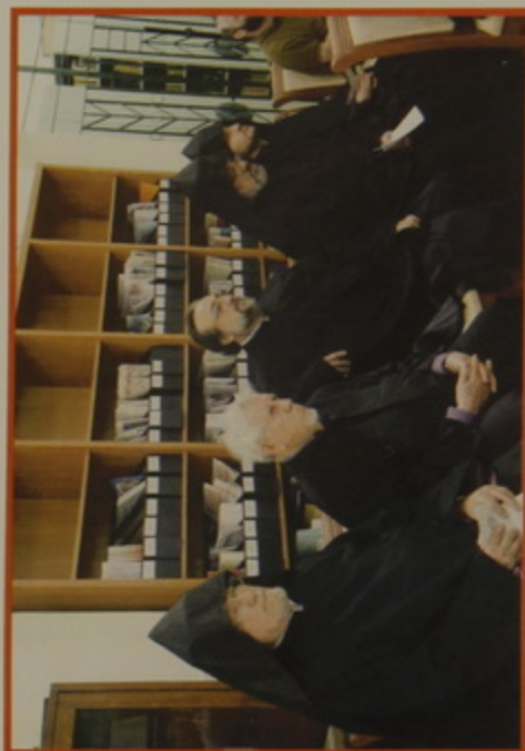
ԳԶ.-ԴԶ. 24-25 Յունիս 08.- Գալուստ Կիլիպենկեան Մատենադարանին մէջ - Գիտածողով. «Հայութեան Ներկայութիւնը Ս. Երկրի մէջ». (Տես էջ 201):