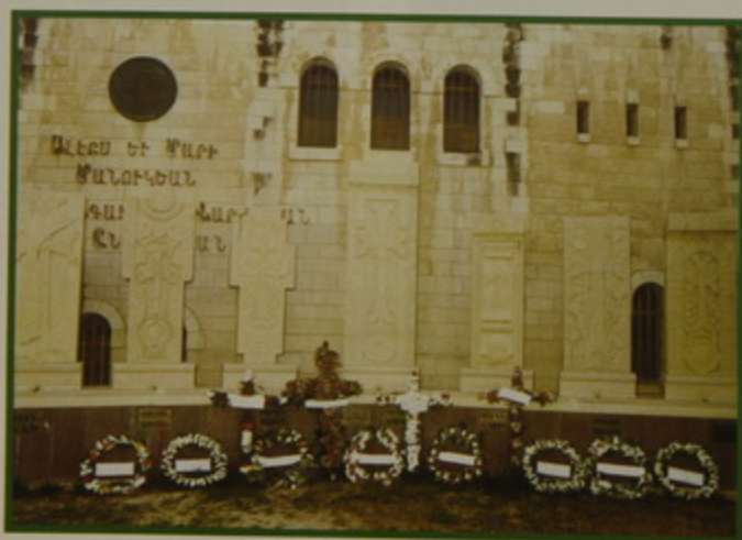
Աւագ Դժ. 23 Ապրիլ 08.- Հայկական Յեղասպանութեան յիշատակին կառուցուող յուշարձանին մօտ Հոգեհանգստեան պաշտօն: