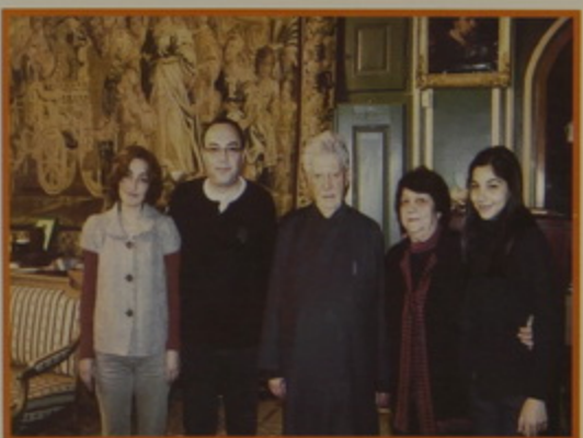
Չատուրյան շրջանի ուխտաւորական հիւգ խումբեր.- Պոլիսէն, Ֆիլատելֆիայէն, երկու խումբեր Լոս Անճելոսէն, եւ Մարսիլիայէն: Իսկ Եգիպտոսէն, Մարտ 16-ին, Հայաստանի լիազօր Դեսպան Տիար Ռուբէն Կարապետեան իր ընտանիքով: