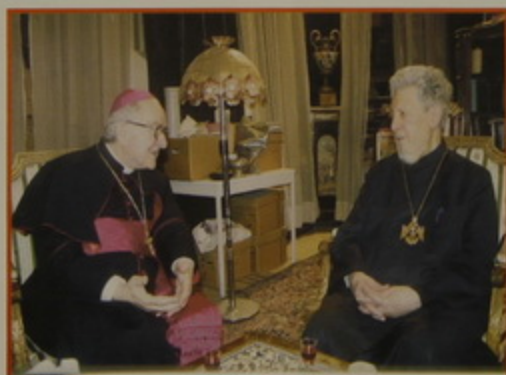
Գ2. 29 Ապրիլ 08. - Չատուկան տոնին առիթով շնորհաւորանքի համար Պատրիարքարան այցելեցին Լատին Պատրիարքութեան, Ֆրանչիսկեան Միաբանութեան, Կաթողիկէ, Անգլիքան, Լուտերական եւ այլ յարանուանութեանց, եւ Ղպտի, Ասորի եւ Հապէշ Ուղղափառ եկեղեցիներու Հոգեւոր Պետեր եւ Ներկայացուցիչներ, եւ Պապական Նուիրակ Անթոնիօ Արք. Ֆրանցո: