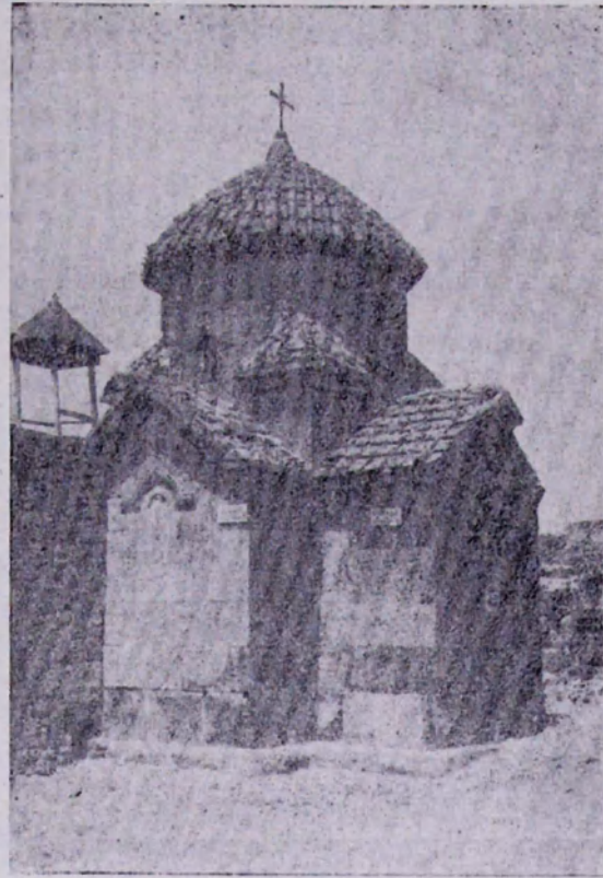
Աշտարակ.—Կարմուսավոր եկեղեցին հարավարևելքից՝ մինչև վերամորոգումն ու բարեկարգումը:

Սա է դարին խիստ բնորոշ ու առանձնահատուկ կենտրոնագմբեթ մի գեղեցիկ ու հետաքրքիր կառուցվածք է, որն ունի խաչաձև հատակագիծ՝ ուղղանկյուն խաչթևերով: Խաչթևերի միացման անկյուններից ձգվող գլանաձև կիսասյունները միանալով կամարներով իրենց վրա են կրում՝ ութակող, ցածրադիր թմբուկ և բութ վեղար ունեցող գմբեթը, որը հիմքին փոխանցվում է տրոմպների