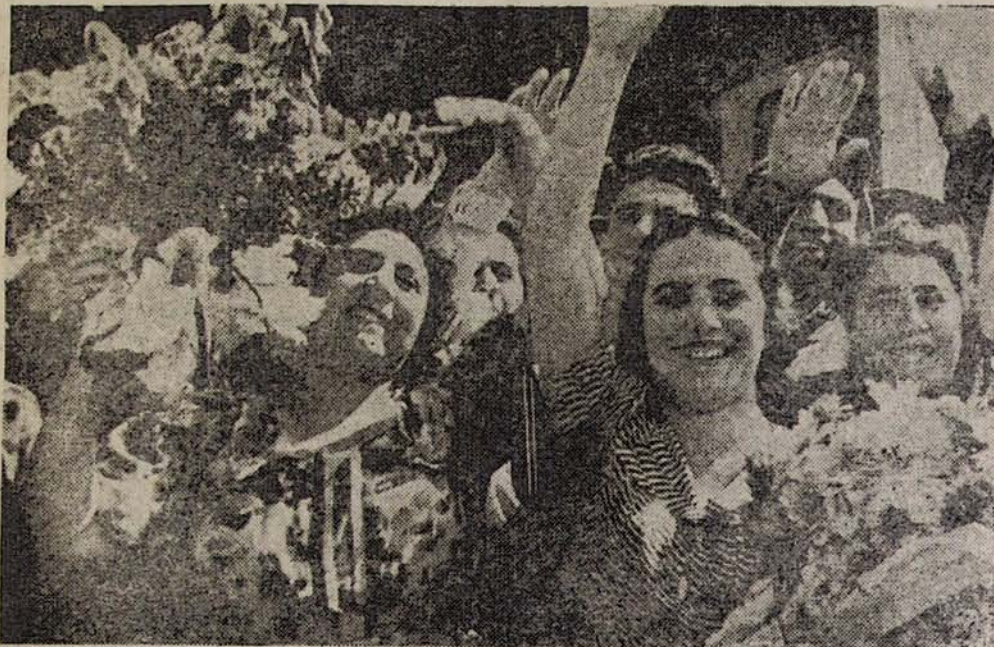
Երևանի կայարանում. դիմավորողների մի խումբ

— Յարաբ այս եկողները տեղեկություն չեն ունենա իմ բալից, որին կորցրի ես տարագրության սև օրերին. ասում են եկողների մեջ մեր համագյուղացիներ էլ կան: — Մի գուցե հենց եկվորների մեջ է,—