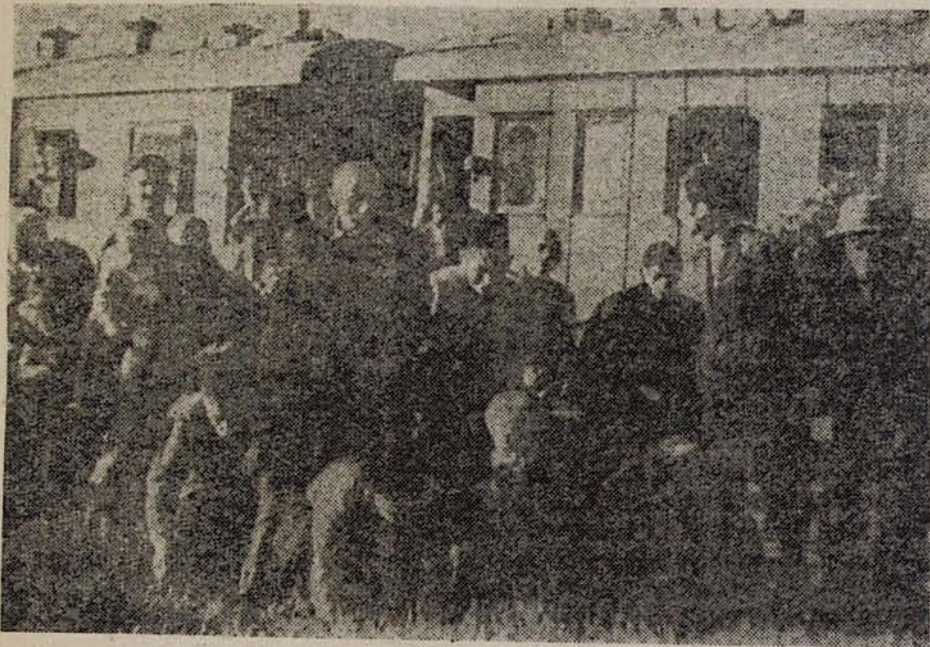
Գնացրը կանգ առավ հայրենի հողի վրա. Եկվորները զննցից իջել ու համբուրում են հայրենի հողը.

Կովետական նոր քաղաքացիները Բաթումիից հատուկ գնացքով մեկնեցին Սովետական Հայաստան՝ Հայ պանդխտի տարիներով նուազած նվեալաց երկիրը: Հայաստանի երկաթուղային կայարանները տունական տեսք էին ընդունել. նրանք զարդարված էին գրողակներով և բարեզալուստի ու ողջունի բազմաթիվ լոզունգներով. «Բարի գալուստ, մեր հարազատներ», «Բոցավառ ողջունն արտասահմանյան մեր եղբայրներին՝ Կովսոդային բերքառատ դաշտերի աշխատավորներից», «Ողջուն սովետական նոր քաղաքացիներին», և այլն: Շատ վայրերում կայարանումներձ շրջանների աշխատավորու-