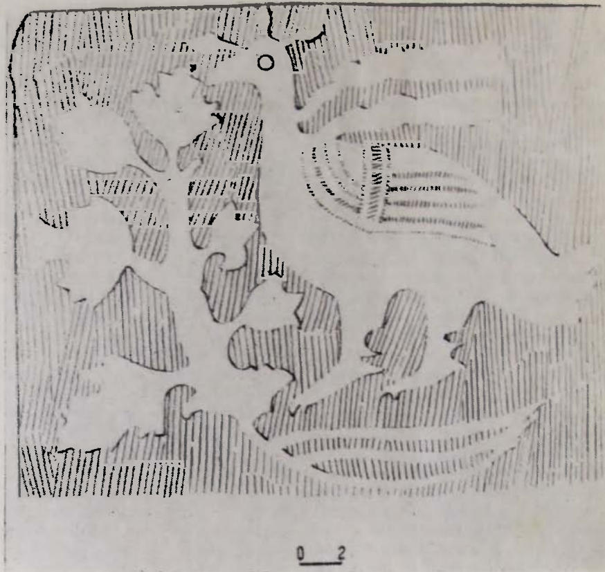
Рис. 1. (реконструкция).

литы в формах. Плитки употреблялись для внутреннего убранства построек гражданского характера. Место находки не исключает возможности их употребления для внутренней отделки одного из залов дворца, расположенного южнее усыпальницы.