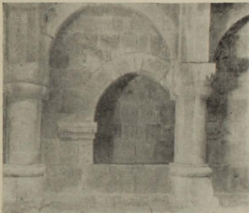
Նկ. 5. Դրատան ներսը գրապահոցի դարակով

Միջնադարյան Հայաստանում մեծ համարով է վայելել Հաղրատի գրատուներ, որտեղ պահվել է հայերեն լեզվով գրված ամեն բան: Կան տեղեկություններ այն մասին, որ վանքի գիտուն միարաններն աշխատում էին իրենց շունեցած գրքերն անուայմանորեն արտագրել որևէ տեղից և պահել գրատանը: Հաղրատն ունեցել է գրչության իր դպրոցը, իր գիտնականները, որոնցից մի քանիսը մեծ հռչակ են վայելել ամբողջ Հայաստանում: Այնտեղ գրվել են բազմաթիվ ձեռագրեր, որոնց թվում մի քանի գլուխգործոցներ, ինչպիսին է, օրինակ, Հաղրատի (Գետաշենի) 1211 թ. ավետարանը, որ ծաղկել է նկարիչ Մարգարեն: