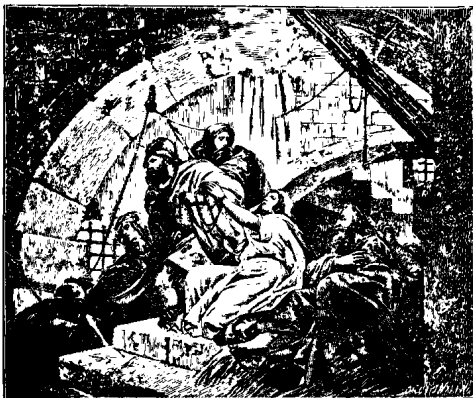
Նահատակութիւն Ս. Սանդրիտայ .

Զարարիայի յաջորդ գրեն մեր վերջին դարու ժամանակագիրք կամ եկեղեցական վիճակագիրք, ինչպէս Բովսէփ Վ. Զուլայեցի, զԶմեմեռն կամ Զմեմեռնեան վերոյիշեալն, որ էր յառաջն «Իշխան ամենայն ձանապարհ» «հաց» և հաւատարմի ի դրան արժուին. և