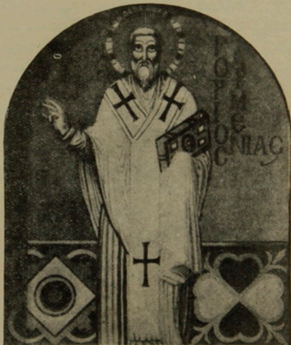
Ս. Գրիգոր Լուսաւորչի խնամկարը

դերքի մը մէջ՝ կ'աղօթէ իրեն. միտն է Ս. Գրիգորի կենդանադիրը, ոտքի վրայ, մէկ ձեռքը աւետարանն է, միւս ձեռքը խաչակնքման ժեսն է ընող. երբորդը կը ներկայացնէ Ս. Գրիգորը, Հայրապետ Հայոց (Popiuc Armeniac) ինչպէս գրուած է նկարին վրայ: Այդ խճանկարները բնականաբար արուեստի ամենէն զեղեցիկ արտադրութիւններէն են, յօրինուած Յուստինիանոս կայսեր օրով (ճիշդ դար), երբ Այա-Սօֆիայի մայր եկեղեցւոյն նախնական շինութեան տեղ չորս տարուան աշխատանքով կանգնուեցաւ արուեստի այն հոյակապ յիշատակարանը որ դարերէ ի վեր զեղատէրներուն