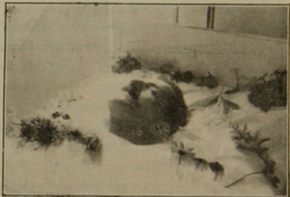
Յովհ. Ասպետ իր մահուան անկողինի մէջ

գրական սիրուն հատուածներ, կրնան շարք մը գեղեցիկ հատորներ կազմել։ Զարմանալի է որ վէպեր պատրաստելու համար շատ մը յատկու- թիւններ ունեցող այդ գրագէտը Միամիտի մը արկածներէն ի վեր՝ որ ինքնակենսագրական տեսակ մը վէպ է, սեւէ մեծաշունչ վէպ շար- տադրեց, ու միշտ իր տաղանդն արտայայտեց նորավէպներով, հակիրճ պատմութեանով։ Կեանքի պայմանները թէ իր իսկ խառ- նուածքն էր ատոր պատճառ, չեմ գիտեր։ Բայց կարգալով իր լաւագոյն պատմութեանը եւ պատկերները, ուր կը գտնենք այնքան սուր ու ներբախտիչ դիտողութիւն, տիպարներու հո- գեբանութեան ճշգրիտ լմբոնում ու կենդանի արտայայտութիւն եւ պատմելու շնորհք,