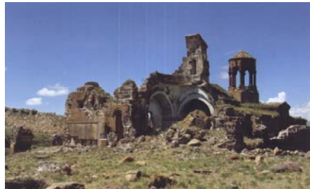
The Monastery of Horomos in 2008.