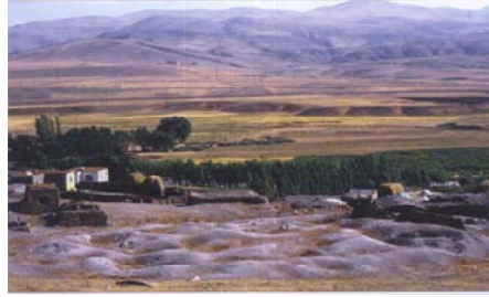
St. Hovhannes Church of Bagavan, Remaining Site, 2008.