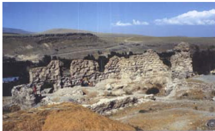
The Debris of Cathedral of Tecor, 1976.