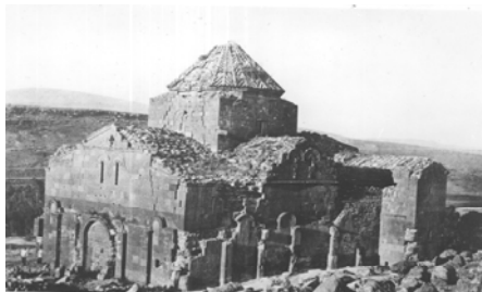
Cathedral of Tecor, 478 – 490, Overall View in the Early 20th Century.