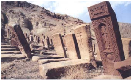
Cross Stones at the Cemetery of Julpha, 15th – 16th cc.