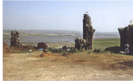
The Holy Savior Church of Shirakavan. Remaining Debris, 2006.