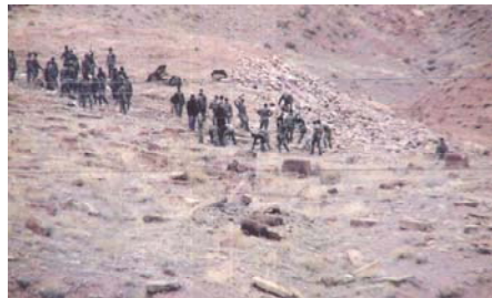
Soldiers of Azerbaijan's Army Devastating the Cemetery of Julfa. (Photo by S. Gevorgian Taken from the Territory of Iran, 2005)