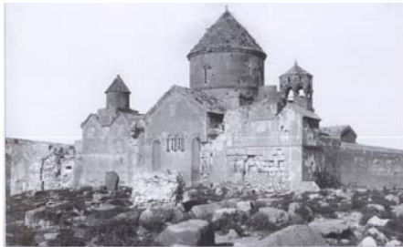
The Monastery of Horomos, 10th – 13th cc., Overall View in the 1900s.