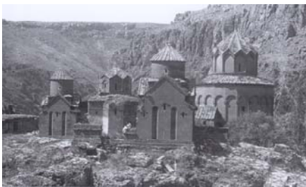
The Monastery of Khtskonk, 10th – 11th cc. Overall View in the Early 20th century.