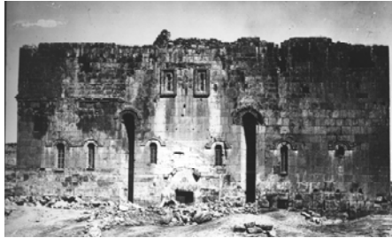
The Holy Savior Church of Shirakavan, 890 – 914. (Photo of the 20th c.)