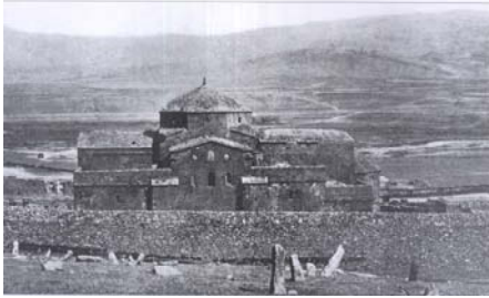
St. Hovhannes Church of Bagavan, 631 – 639.