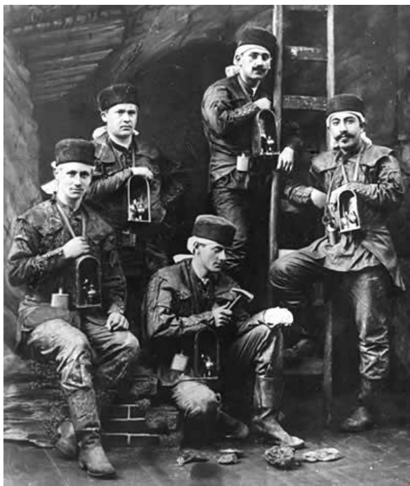
С. Мелик-Степанян (крайний справа) в одной из шахт Германии во время обучения во Фрайбергской горной академии

МЕЛИК-СТЕПАНЯН Смбат Андреевич (21.08.1879 – 24.08.1940], – национальный герой Армении, видный общественный, военный, политический и экономический деятель Армении. Родился в Арачадзоре. В 1905г. блестяще закончил Горную академию во Фрайберге – высшее в то время горное училище во всем мире, не остался в Европе, а вернулся в Армению трудиться на благо Родины.