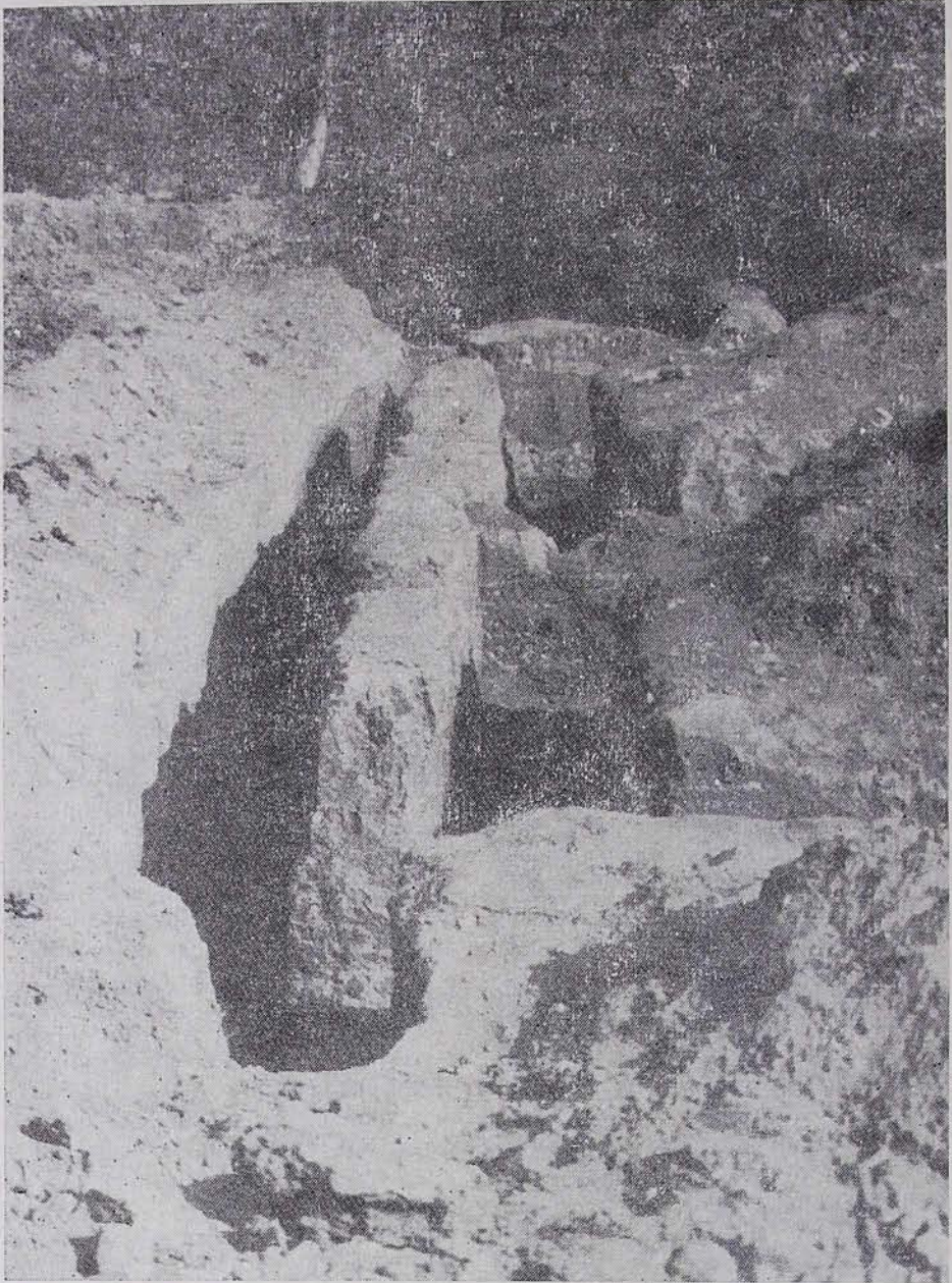
Սկ. 1. Հնգեշտ (այժմ Կոթովսկի բաղաք, Մոլդ. ՍՍՀ)։ Սբ. Աստվածածին եկեղեցու հարավային պատի մնացորդները

րավային կողմում։ Բացի այդ, համալիրի կազմի մեջ են մտնում նաև այլ կառույցներ, որոնք պահպանում են նշված շենքերի արևմտյան կողմի տարածքը։ Այդպիսին են «Սպիտակ հողանոցը» (որը այս անունն է կրում սվաղված սպիտակ պատերի պատճառով) և նախկին ձիանոցի վերակառուց-