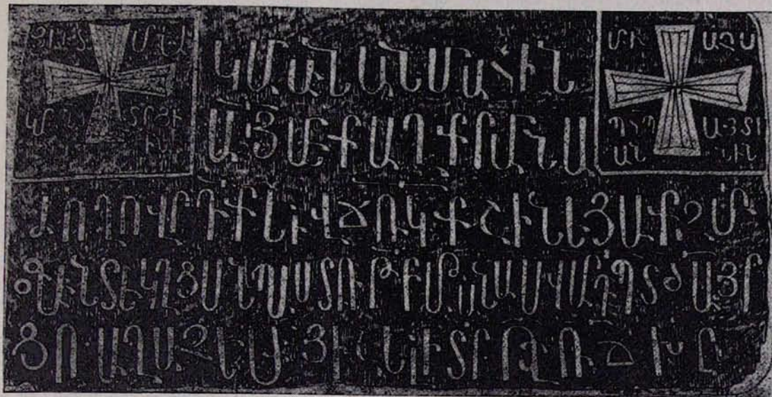
Նկ. 4. Բելգորդ-Դենստրովսկի. 1699 թ. արձանագրությունը

Առանձնապես անհրաժեշտ է կանգ առնել աղոթաարահի հարավ-արևմտյան ավանդա-