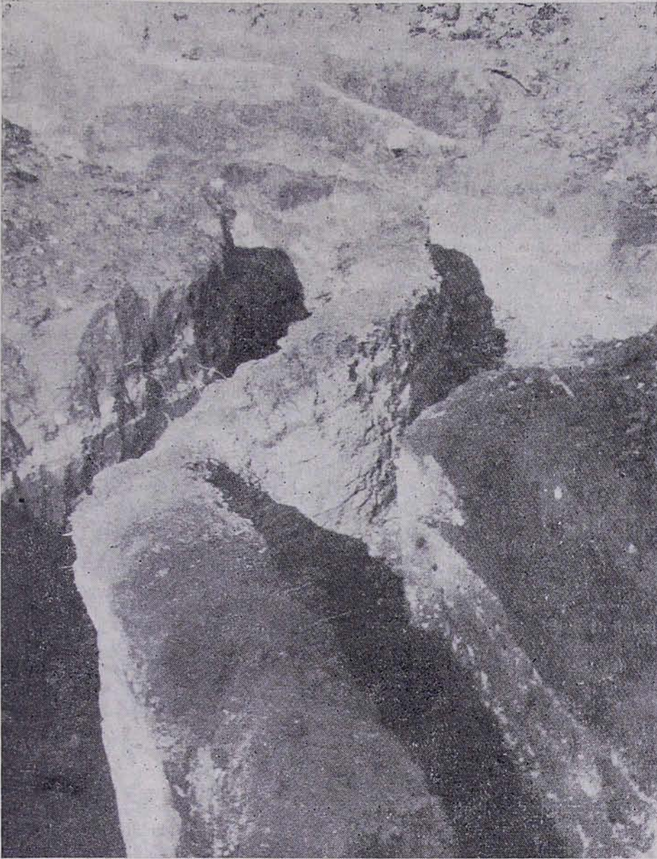
Նկ. 2. Հնչեշա (այժմ՝ Կոթովակ քաղաք, Մոլդ. ՍՍՀ). Սբ. Աստվածածին եկեղեցու արևելյան խորանի պատի մնացորդները

անվերադարձ կորած կառույցների մասին կարելի է դատել միայն առանձին լուսանկարներով, որոնք պատկերում են շենքերի որոշ արտաքին մասերը: